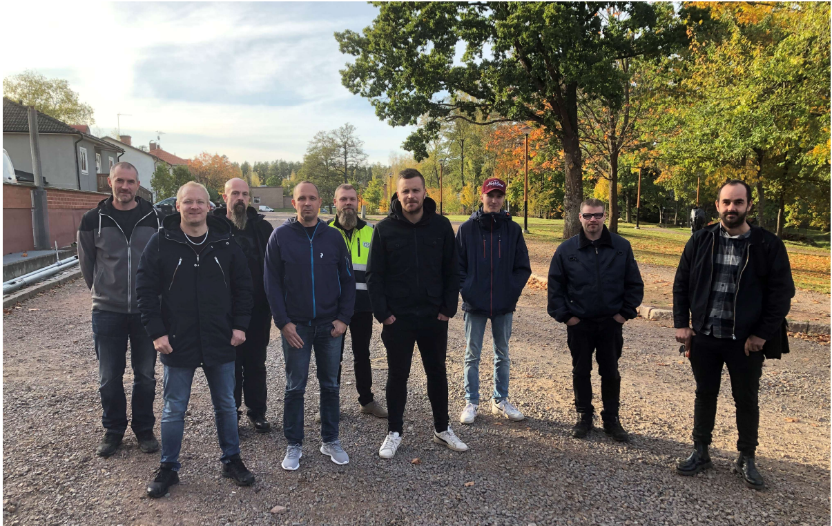
ÖSK:s nystartade rörläggjarlag på Mimervägen i Hultsfred där VA-sanering genomförts under 2020.